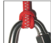
Ankerstich + Schlaufe (AS+)