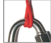
Double Loop (DL)